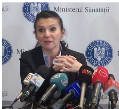
SORINA PINTEA - Ministrul Sănătății

'De la bun început, de când s-a anunțat calendarul protestelor, le-am spus că asta nu este o soluție. Soluția este să stăm cu toții să vedem ce facem, pentru că ICUTR, de exemplu, a fost cu foarte multe arierate. De ce acum arieratele au scăzut? De ce?! Pentru că este o bună gestionare. Până la urmă trebuie să ne uităm un pic și în curtea noastră. De ce un spital funcționează, și